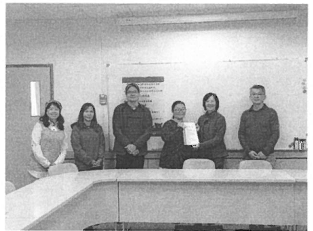
演講結束後，主講者與師長合影