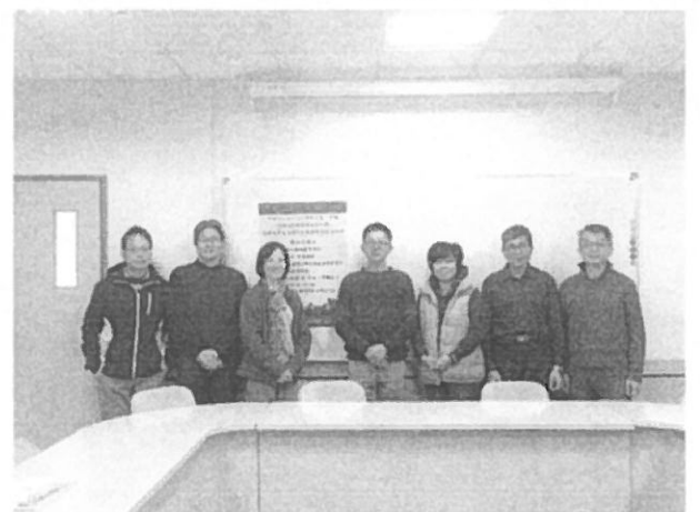
主講者與師長合影