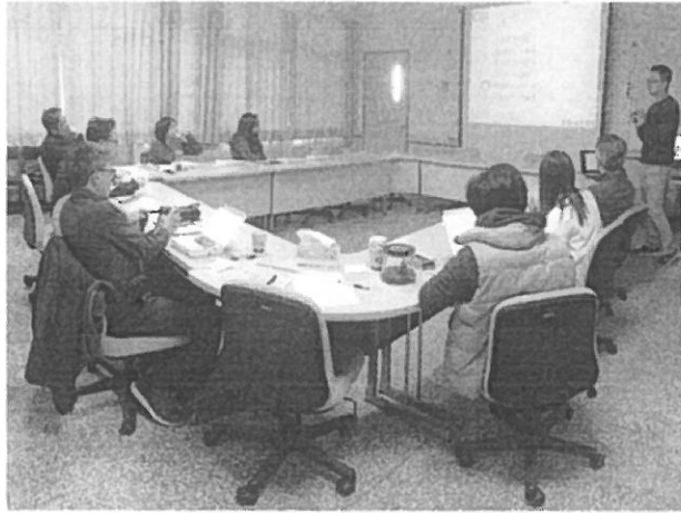
主講人進行專題演講