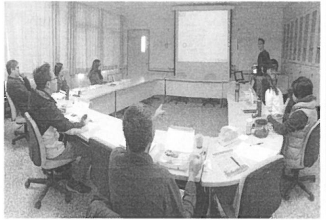
主講人進行專題演講