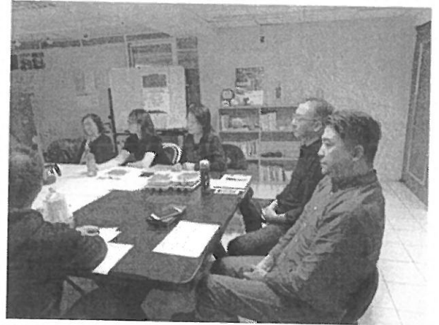
專注於講座的脈絡