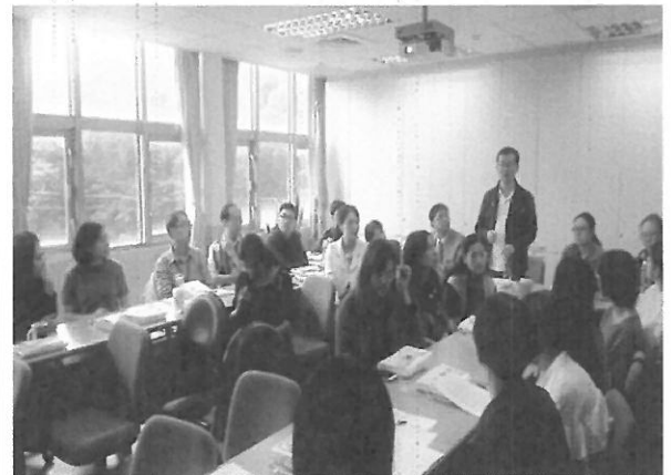
中國勞動關係學院老師與教師們熱烈討論