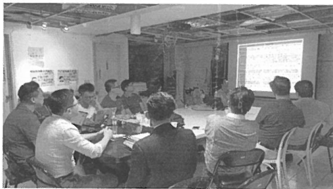
專注於講座的脈絡