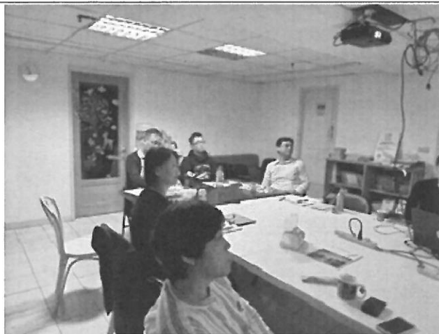
專注於講座的脈絡