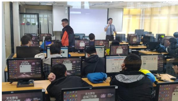
講者與學生的互動。