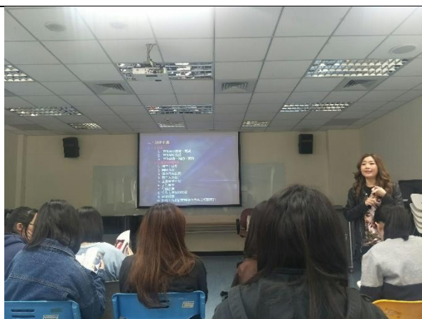
講師介紹一場活動的流程規劃