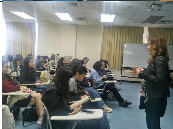
講師與同學們的問與答