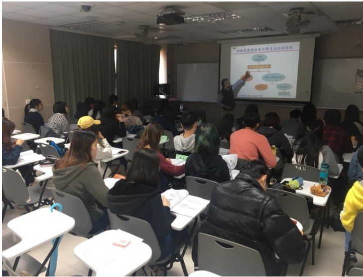
107年10月20日 工作坊實況