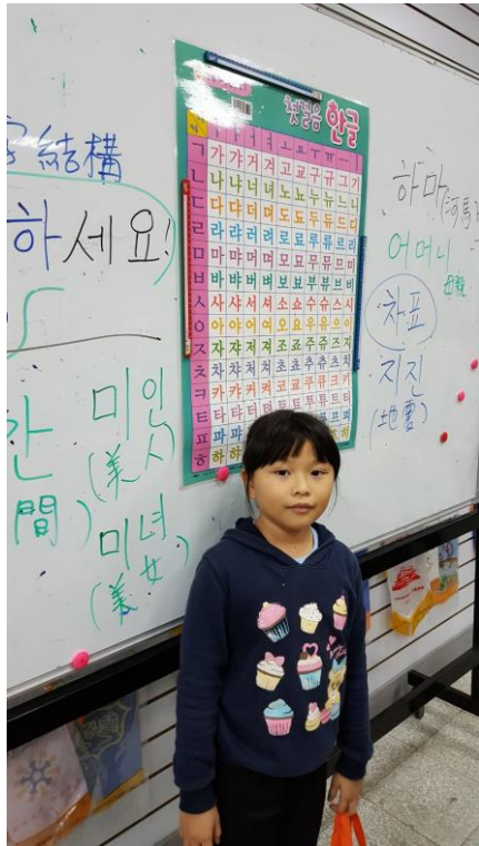
學生上台說出簡單的詞彙