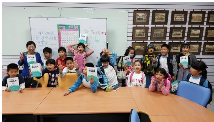
老師和學生大合照