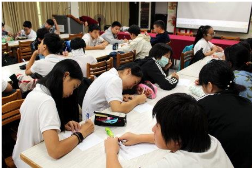
電影欣賞後寫作及發表