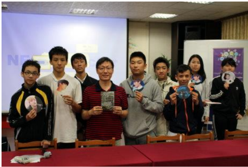
有獎徵答 與獲獎同學合照