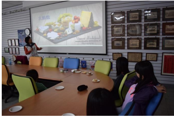
介紹法國乳酪種類。