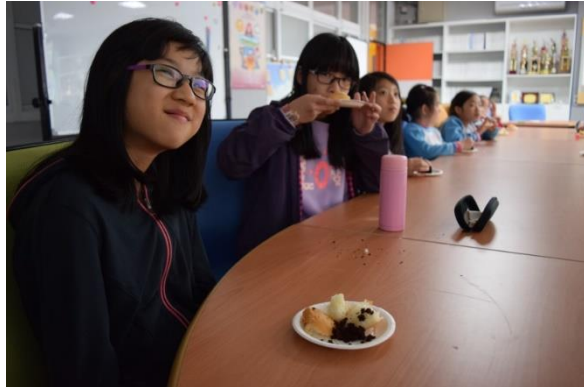
學生試吃法國蛋糕及乳酪。