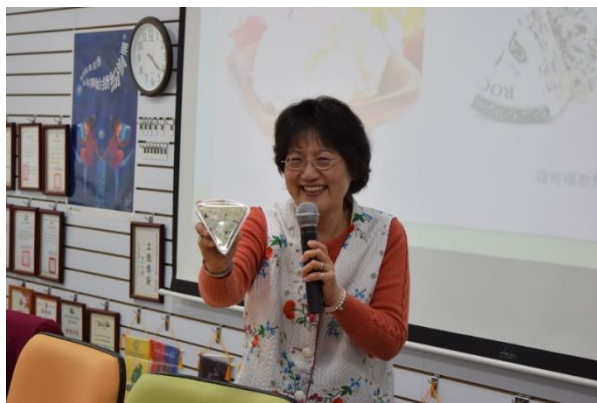
向同學介紹試吃乳酪的特色。