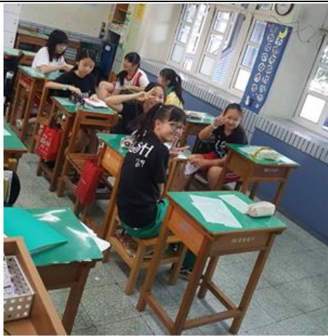
試吃完法國美食， 笑容滿面的學生們。