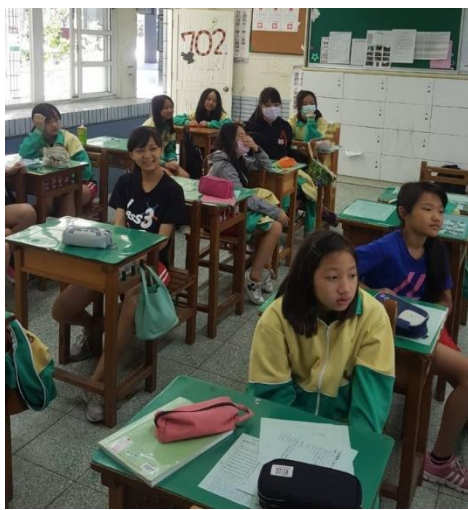
等待法國美食試吃的學生們。