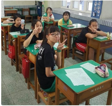
課程中給予許多互動的學生們。