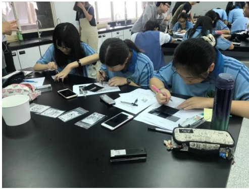
同學們聚精會神進行實作