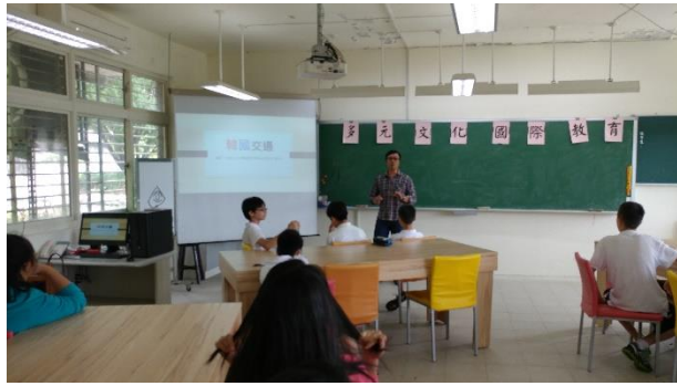
韓國地理資訊說明