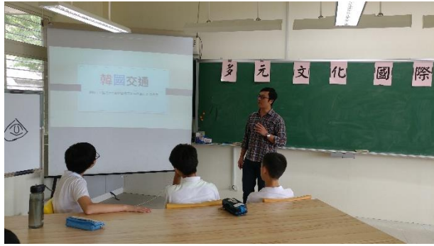
韓國交通資訊說明