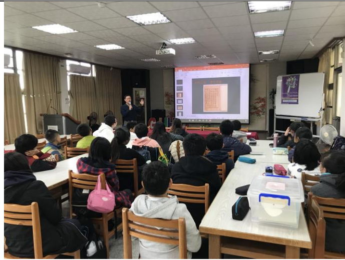
介紹韓文字的母音和子音