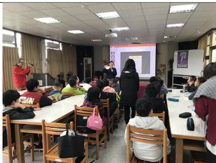
同學搶答正確，獲得小禮物