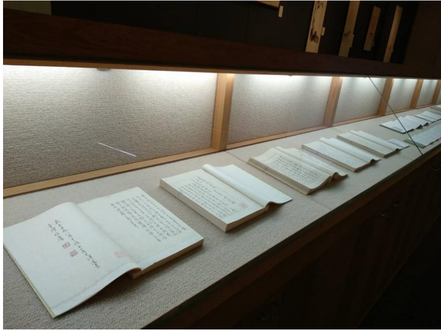
溥儒《四書經義集證》手稿五冊