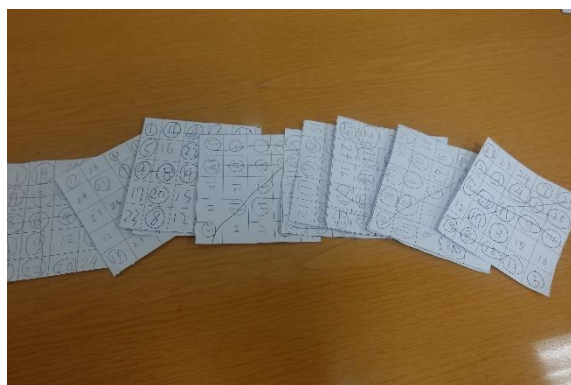
學生使用的賓果表