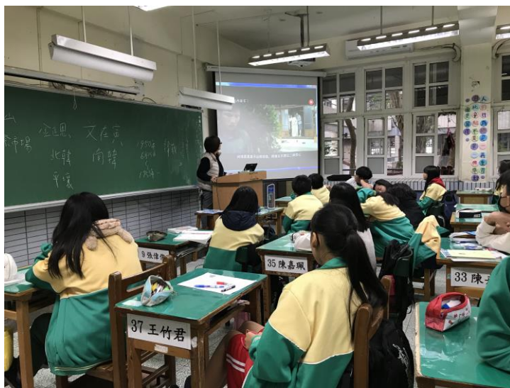
『國際市場』電影欣賞