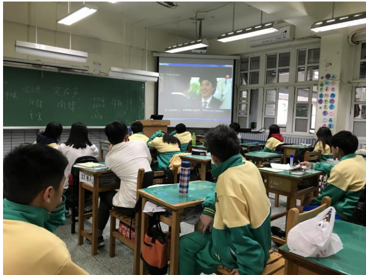
『醜女大翻身』電影欣賞