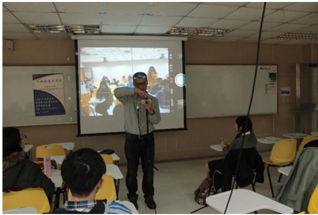
向同學說明用手機拍電影