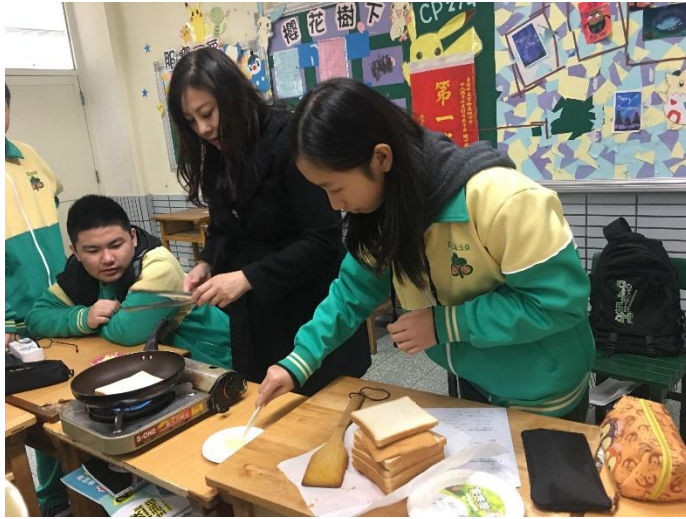
老師指導同學分組製作