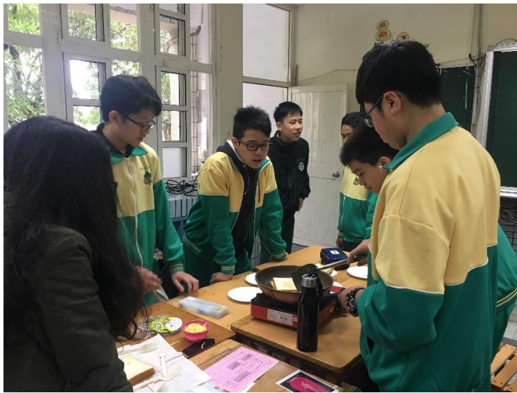
學生分組製作食物