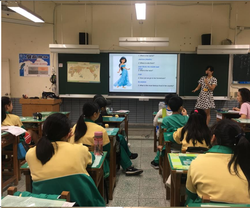
揭曉主題曲後，老師在對公主做介紹。