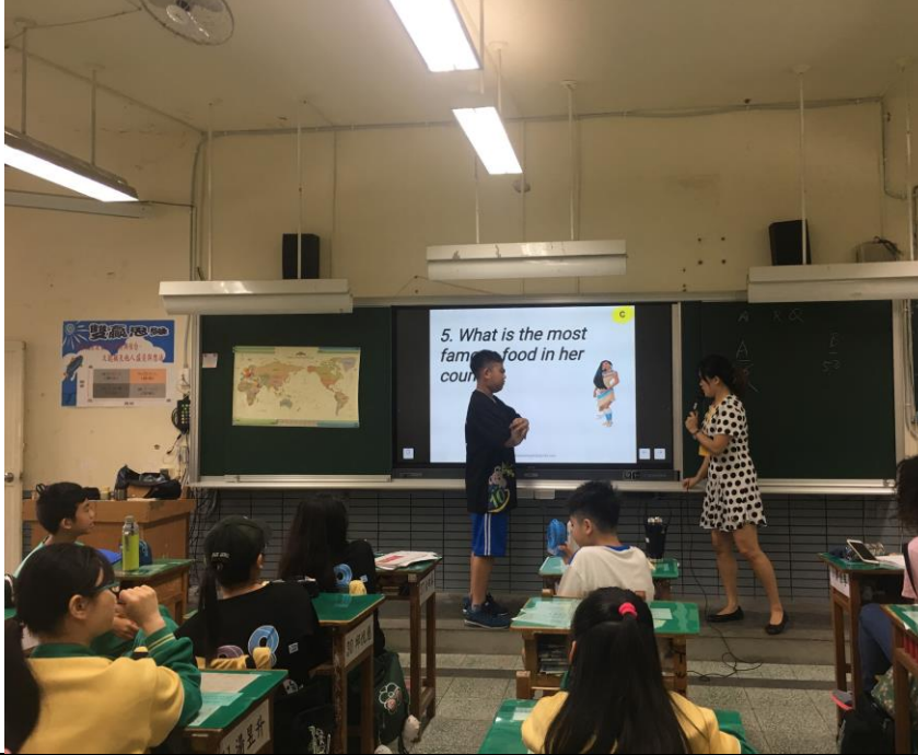
正在進行分組遊戲，學生在回答抽到的問題。