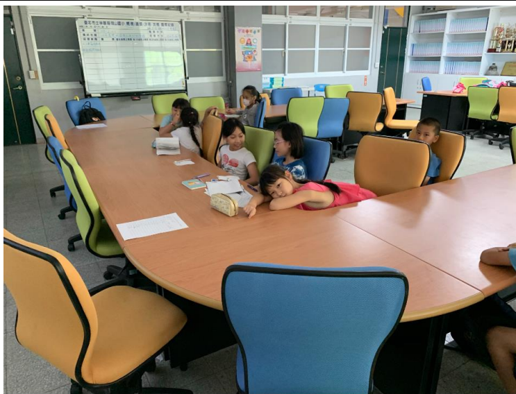
孩童們的休息時間。