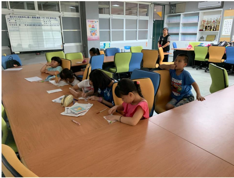
讓孩子們學習寫法文。