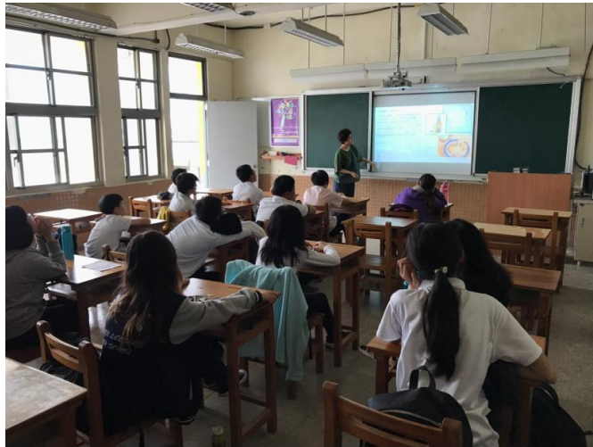
教導正確的用膳方式