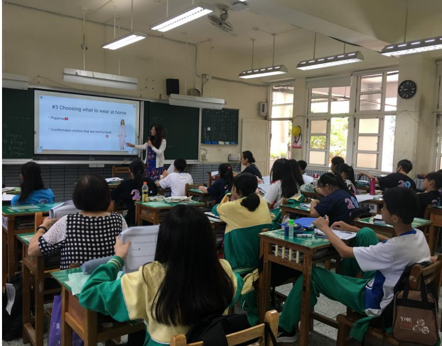
老師在介紹不該犯的禮儀錯誤。