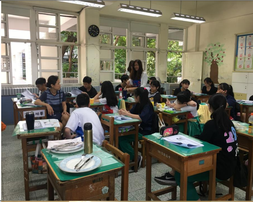
老師幫忙同學分組，並讓同學們討論表演內容。