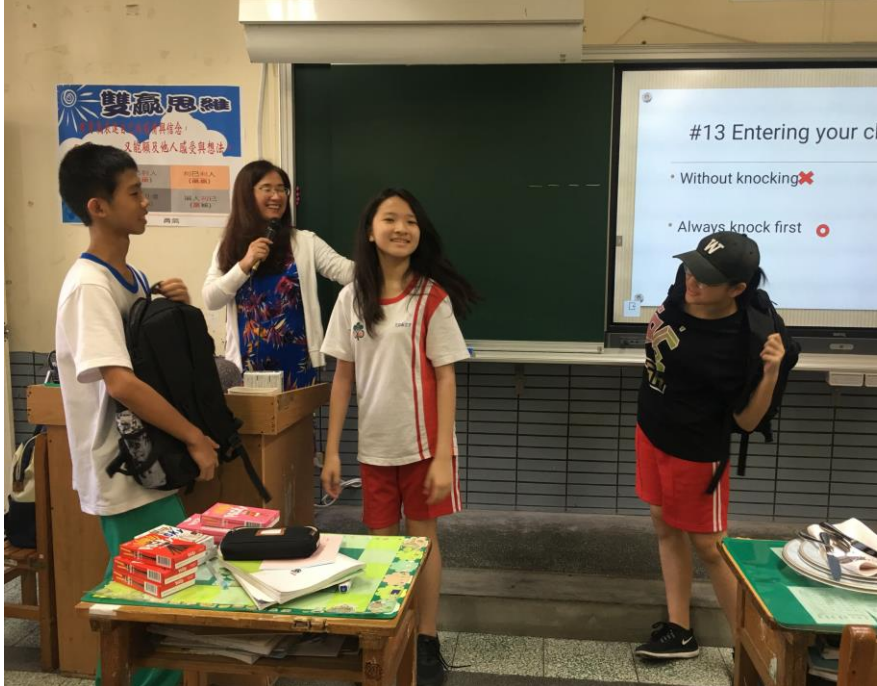
同學們表演錯誤的禮儀。