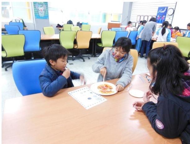
製作完成後和同學一起分享