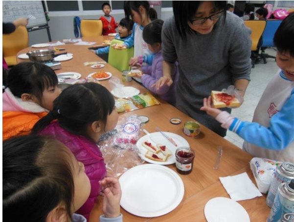
小朋友們一起著手製作互相協助