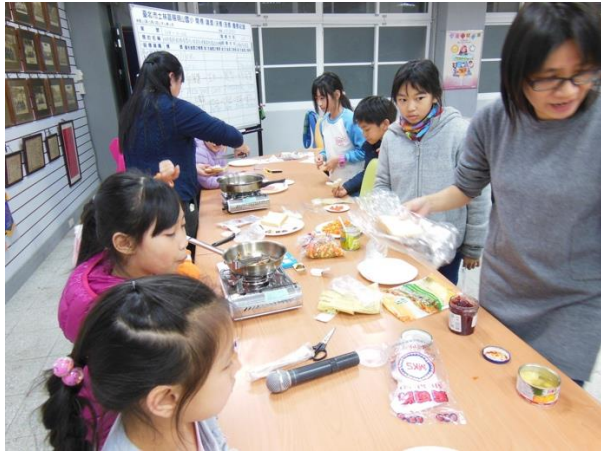
低年級同學由老師協助一起製作