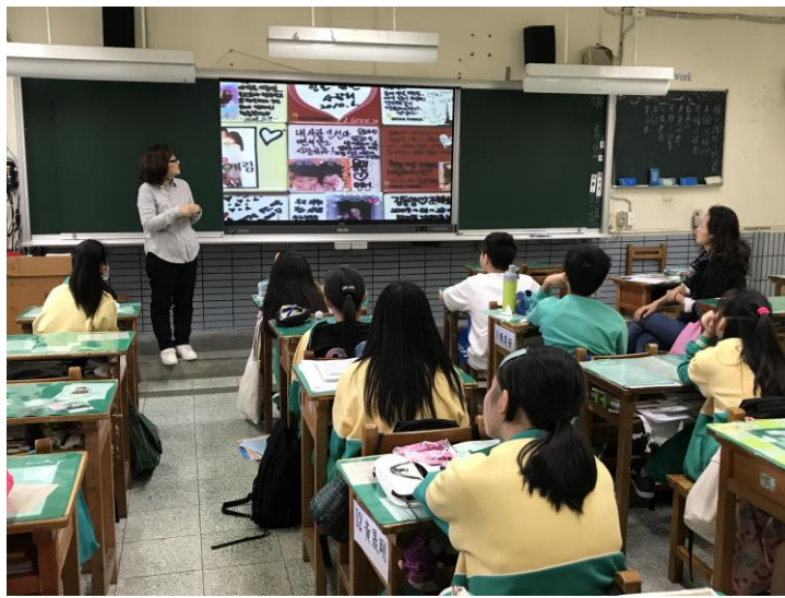
韓國著名觀光景點介紹