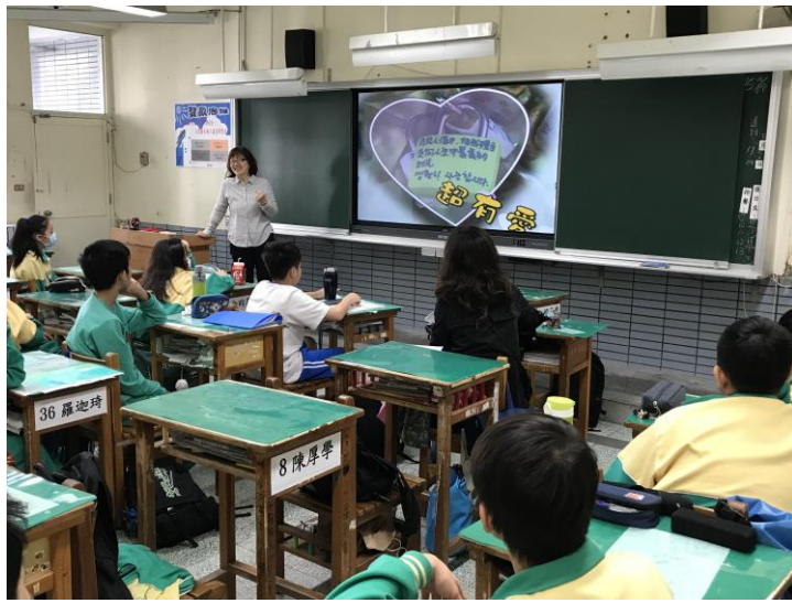
韓國著名光觀景點介紹