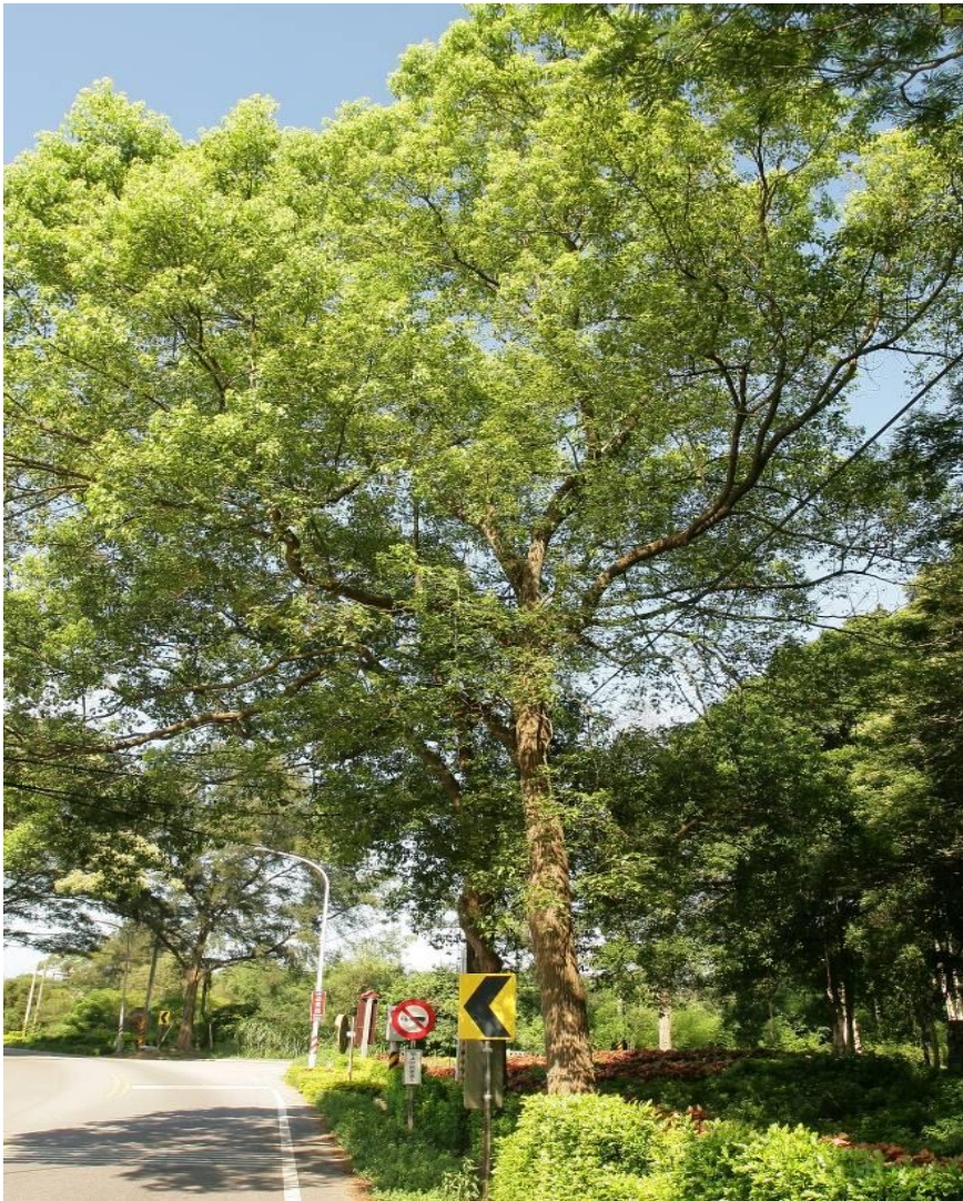
健康的樹木樹冠完整