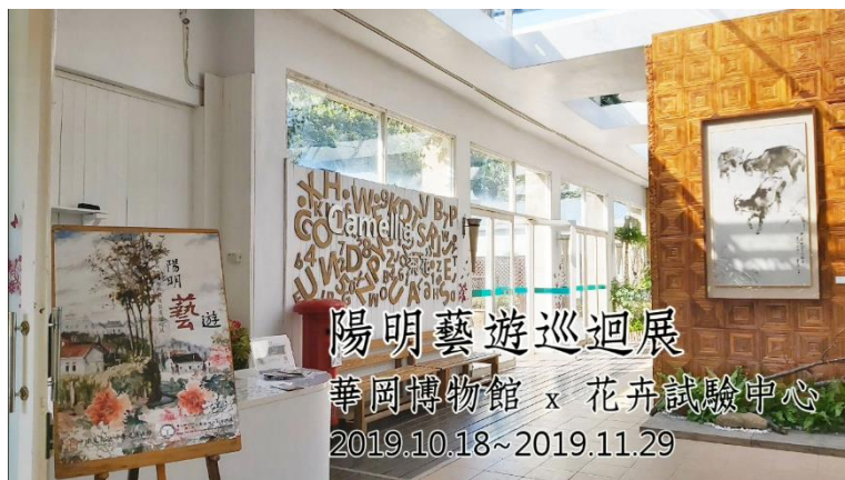
1081_陽明藝遊_花卉試驗中心_活動影片