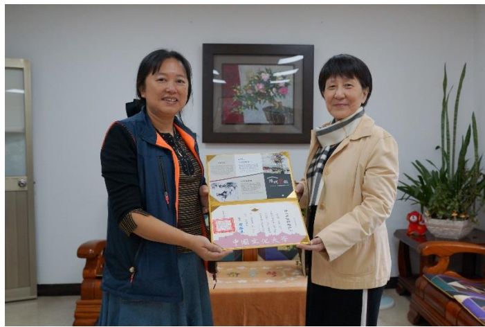
致贈感謝狀予花卉試驗中心