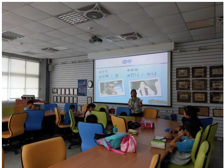
說明韓國稱呼特色