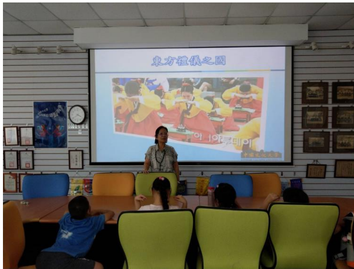
東方禮儀之國介紹