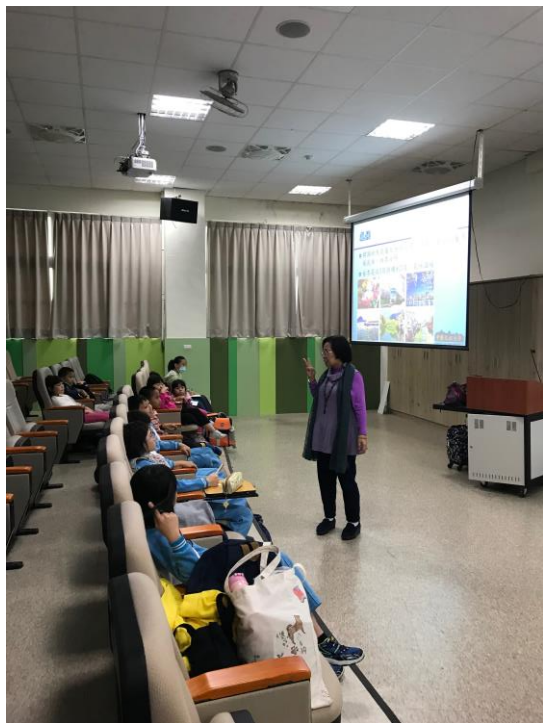
說明韓國四季變化