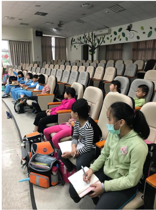
同學舉手發表意見