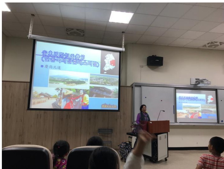
介紹韓國地區特色慶典