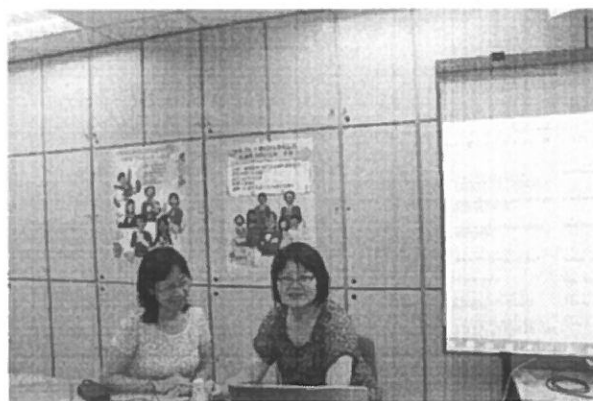
第三場兩位主講人分享了她們的課程並與其他教師討論 PBL 的情境撰寫。