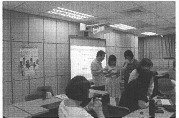
教師們專心學習如何使用 Zuvio 建置新課程與學生互動。