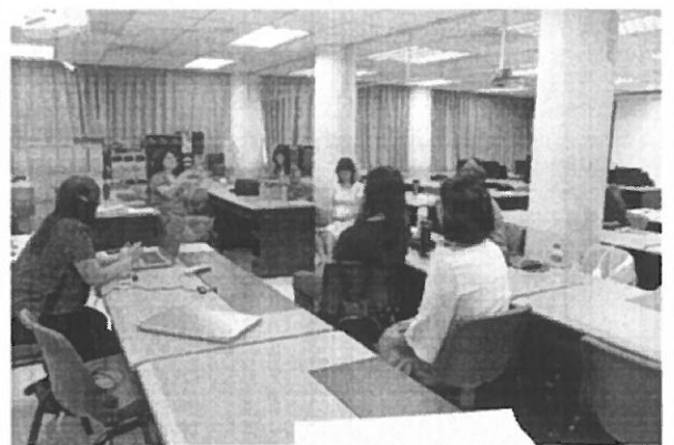
與會教師們熱烈討論並提問有關 PBL 課程的設計及情境的撰寫。