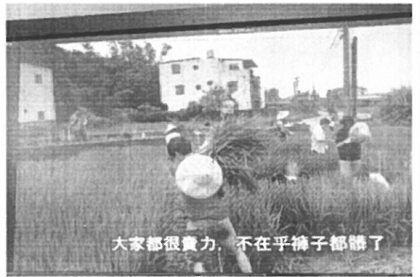
第二場主講人學生的種稻樂實做分享。