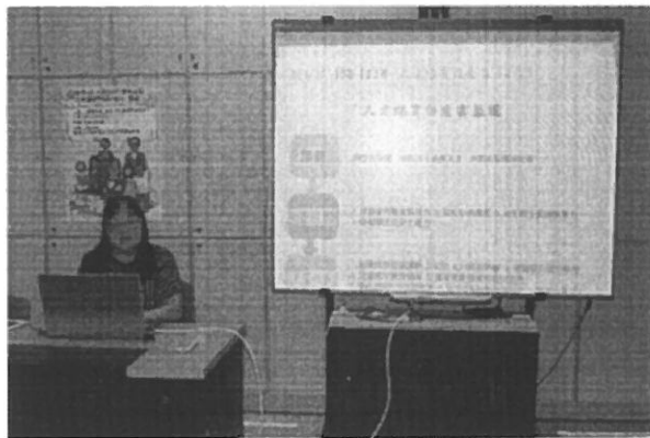
第二場主講人介紹教育部 103-112 年人才培育白皮書及國內為何推廣 PBL 的課程。