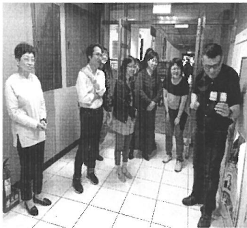
講解如何拍攝分鏡