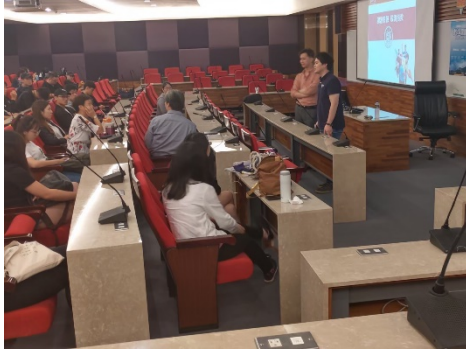
師生互相討論、提出問題