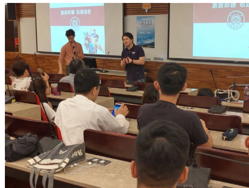
師生互相討論、提出問題