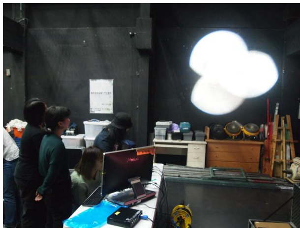
老師指導電腦燈的使用