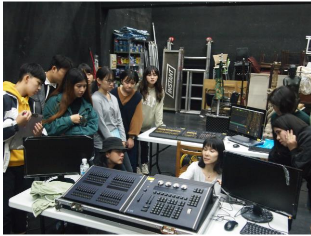
老師講解 ION 的線路接法