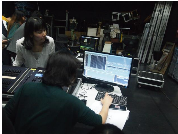
學生實際上控制台練習