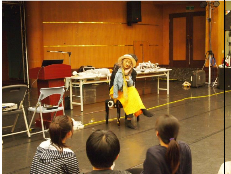
老師一一介紹不同 種類的偶