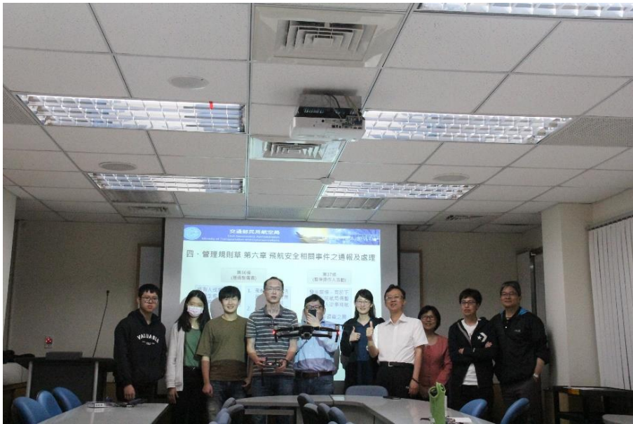
空拍機與參與師生合照