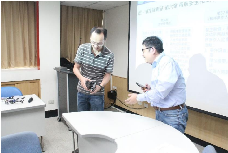
講師與土資系 主任互動