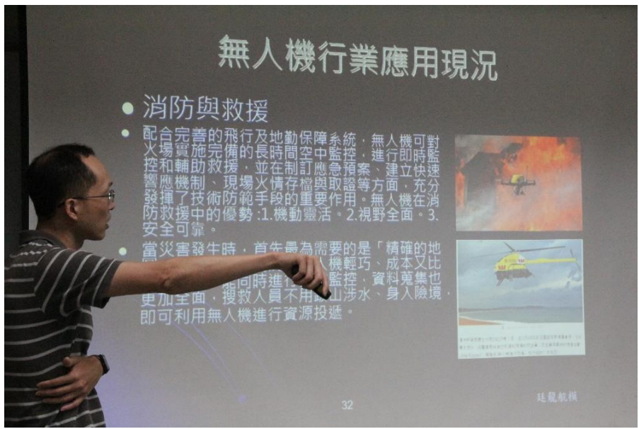
講解目前無人機在各行各業的使用現況