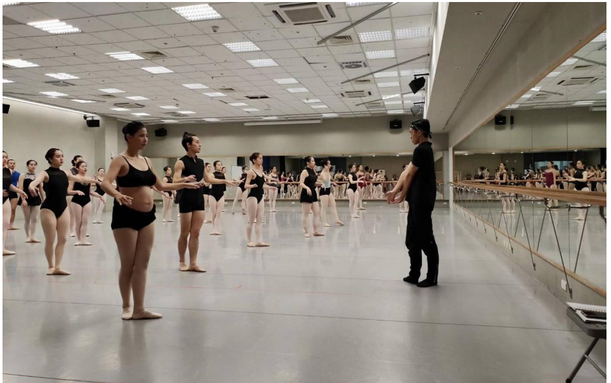
老師講解并示範錯誤及正確的舞蹈姿勢