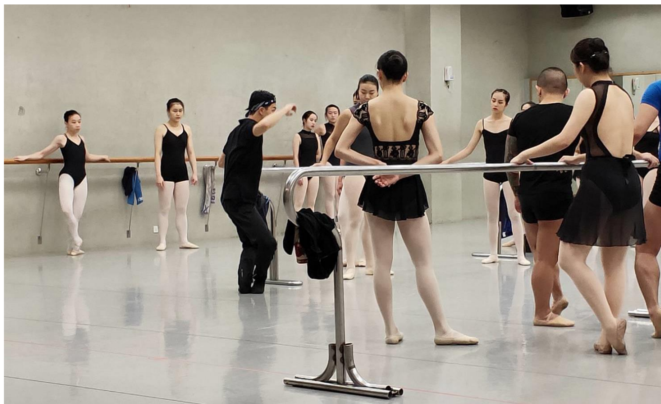
老師示範正確的基本舞步