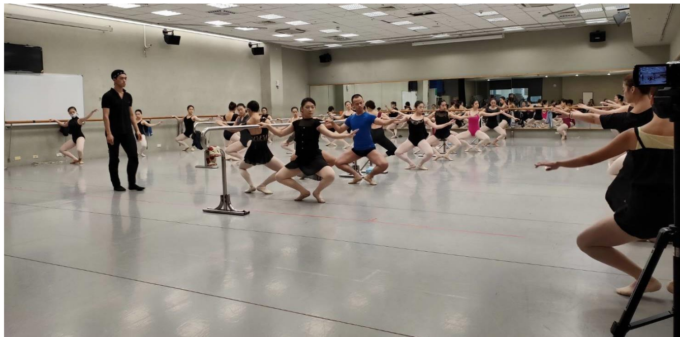
老師讓同學們隨著音樂練習芭蕾舞基本舞步