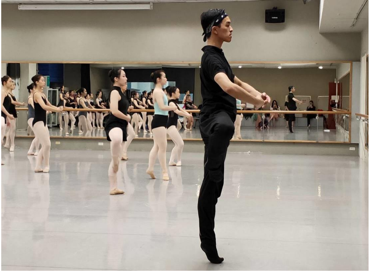
老師帶領同學們一同隨著音樂跳舞