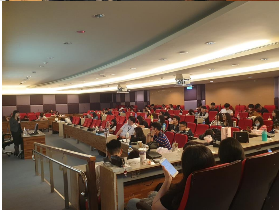
學生上課認真聽課