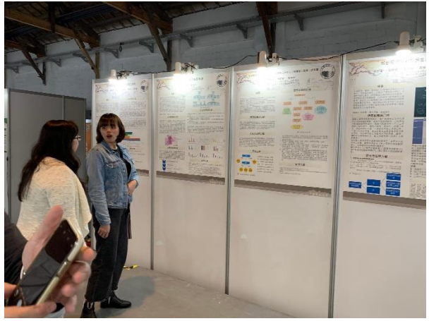
學生詳細解說專題內容