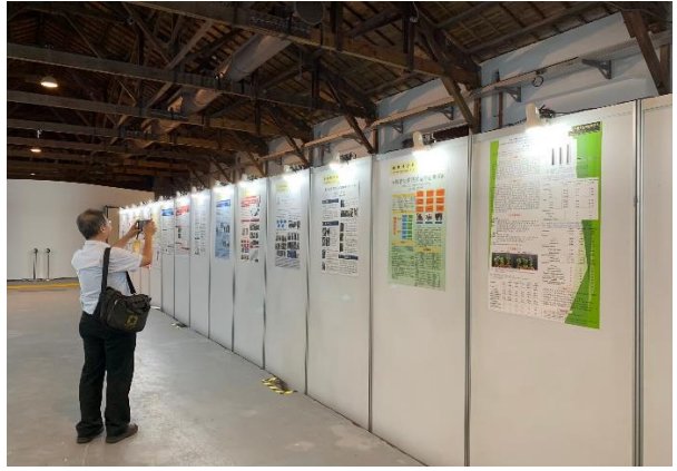
將得來不易的成果紀錄下來