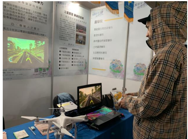
網紅“酷”體驗空拍機模擬