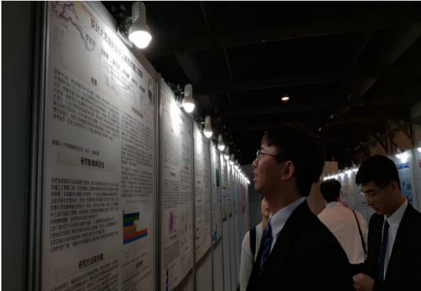
吸引研究所學生前來參訪