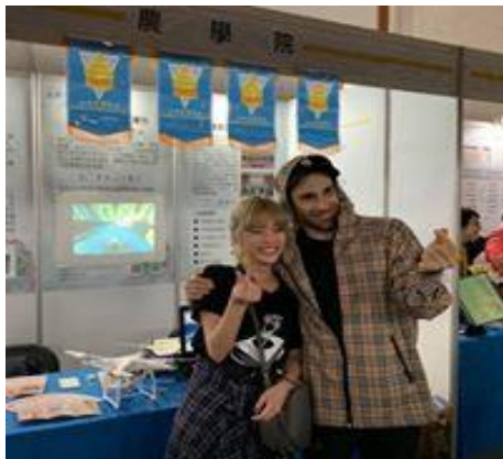
參觀者與工作人員留影