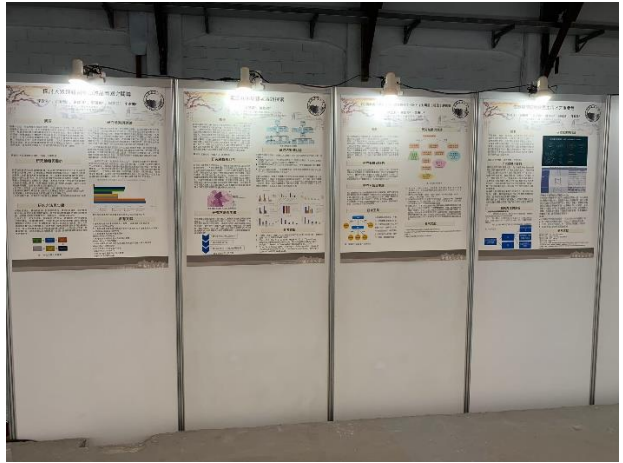
張貼優良學生專題報告