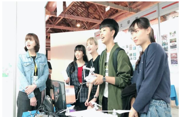
參訪學生體驗空拍機模擬