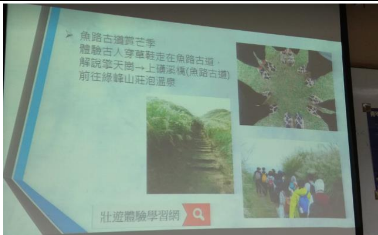
鼓勵學弟妹參加青年壯遊活動