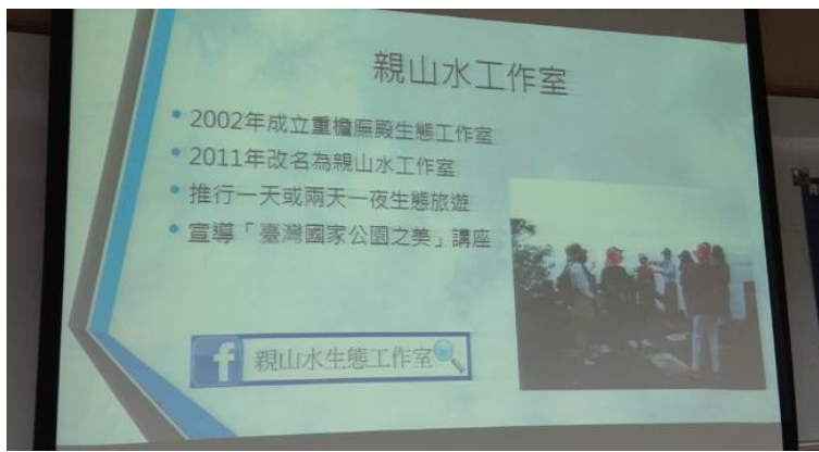
介紹藍染協會親山水工作室