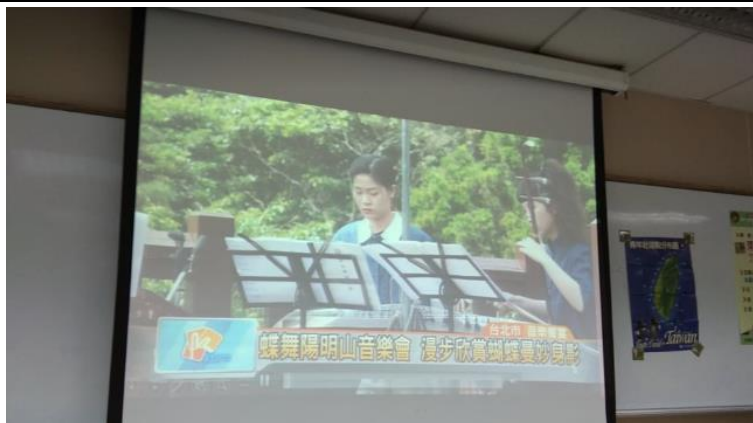
介紹公司正在協助舉辦的蝶舞陽明山活動