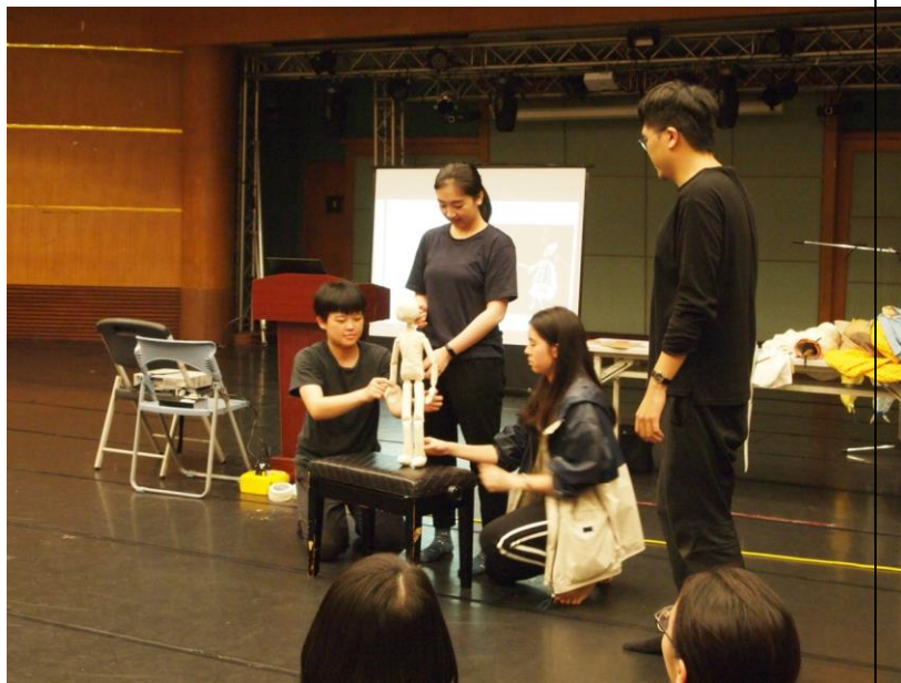
讓三位同學練習需要互相配合的執頭偶