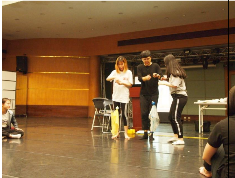
讓同各自練習基本的懸絲偶