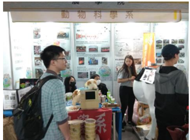
動物科學系展示活動