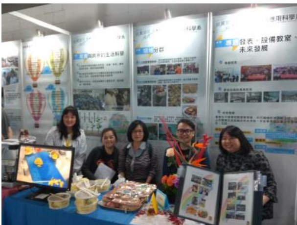
生活應用科學系展示活動