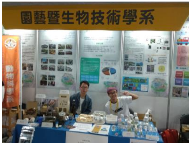
園藝暨生物技術學系展示活動