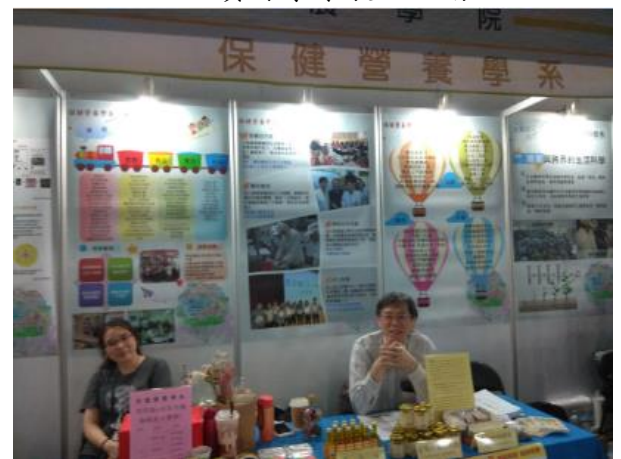
保健營養學系展示活動