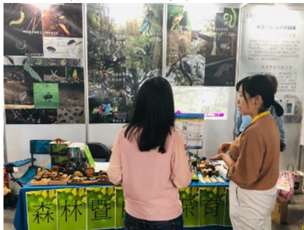
森林暨自然保育學系展示活動