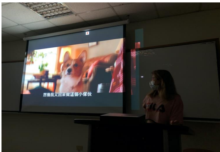
學生介紹 為了與你相遇電影預告配 樂