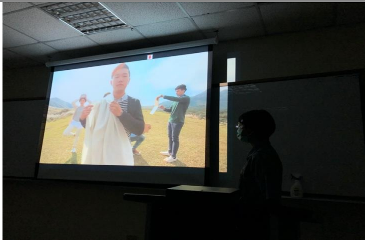
學生介紹 無印良品廣告的配樂