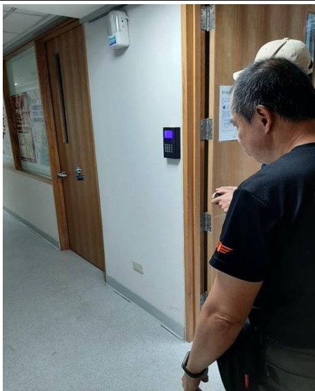
學生自行操作與指導控制