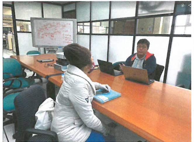
協助同仁課程規劃說明