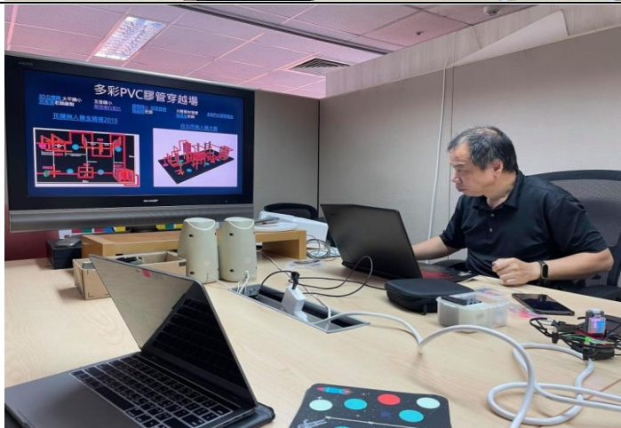
自主飛行 3D 圖認識