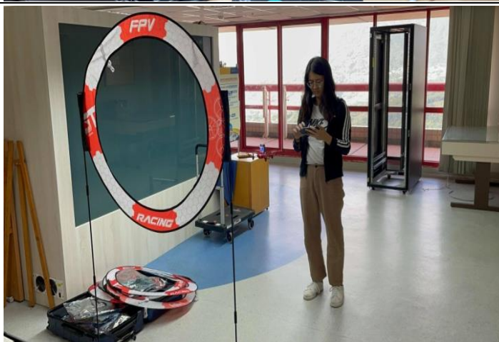
自主飛行實際操作