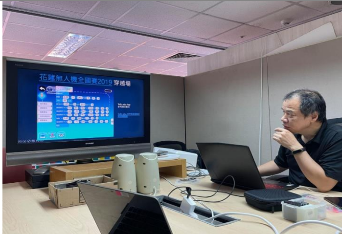
程式撰寫及飛行高度測量