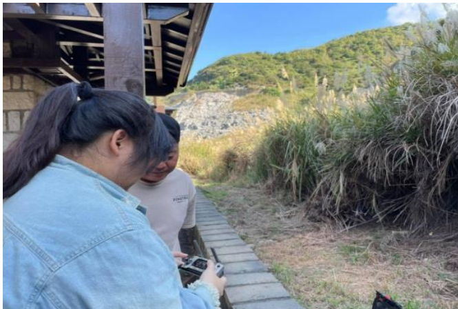
學生實際操作穿越機練習