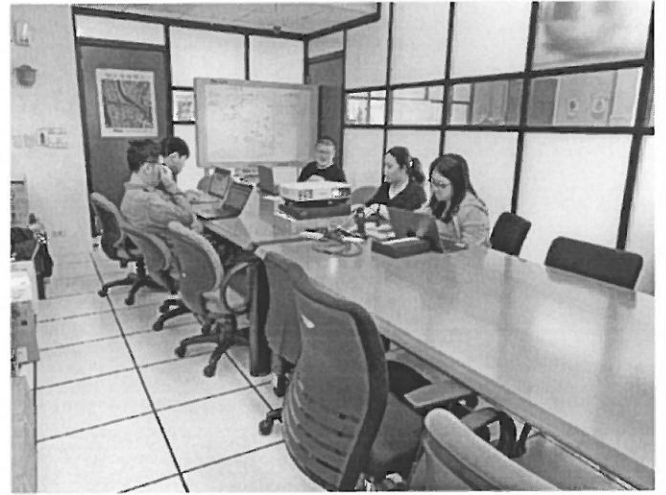
規劃課程安排與運算思維須配合測試的項目