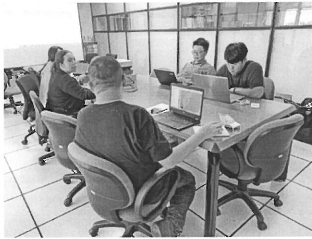
老師說明課程期望呈現的形式