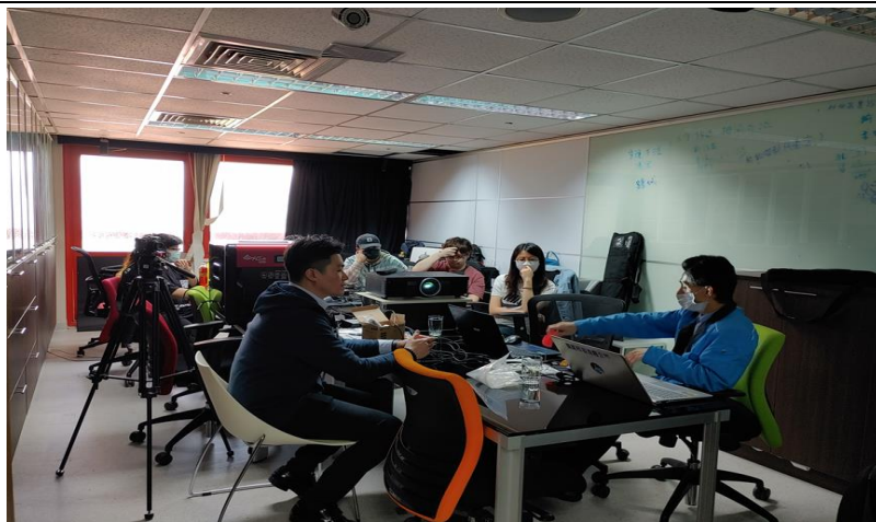
3D 繪圖展示 提問、討論